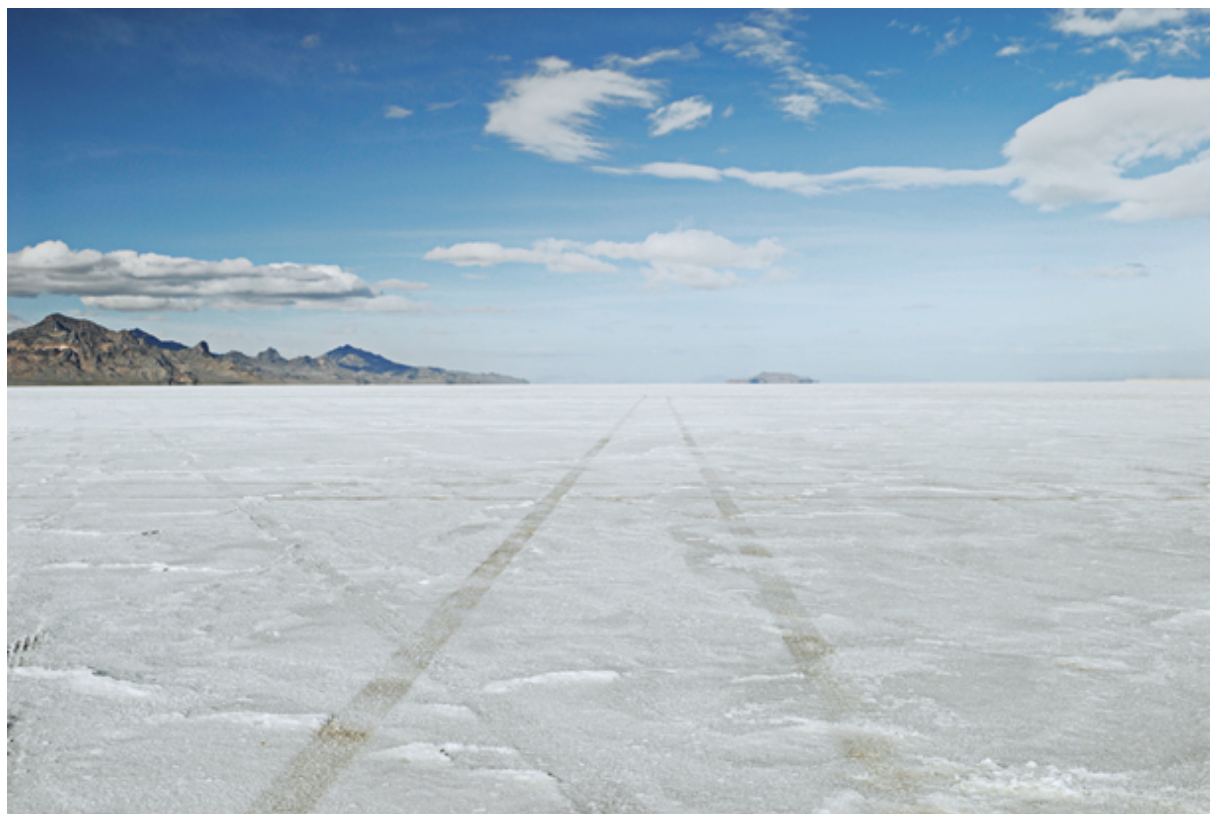
Mit ZEISS T* UV Filter

Die T* UV Filter mit T* Anti-Reflexbeschichtung von ZEISS bieten der Frontlinse Ihres Objektivs optimalen mechanischen Schutz. Wir empfehlen, die ZEISS T* UV Filter ständig als Schutz zu verwenden.