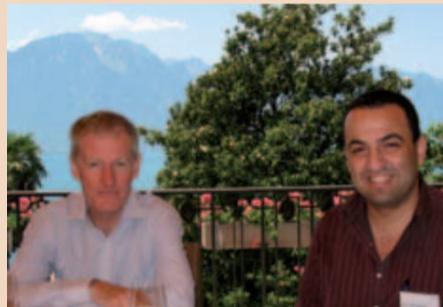
Teilnehmer aus UK und Ägypten auf der Academy Lunch Terrasse im Fairmont Le Montreux Palace.