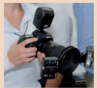
Hier kommt ein Lateralblitz zum Einsatz.