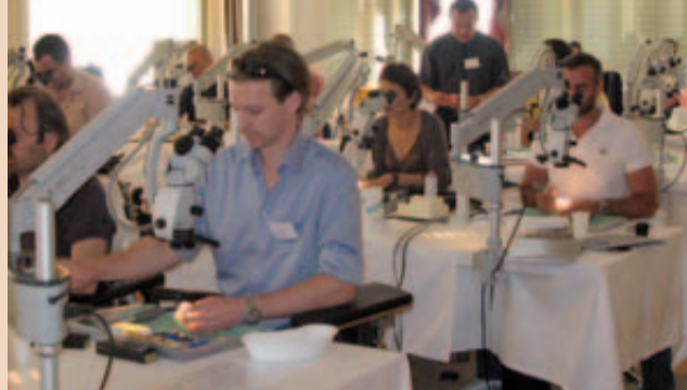
Einer der sieben Workshops: Die Teilnehmer üben mikroinvasive Restaurationen unter der Anleitung von Prof. I. Krejci.