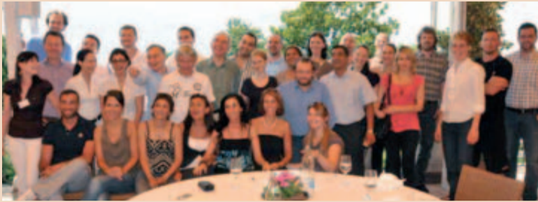
Zahnärzte aus über 20 Nationen praktizierten in Montreux Micro Dentistry.

Fortbildung für Zahnmediziner auf höchstem Niveau: Vom 6. bis 11. Juli 2010 fand in Montreux der „International Dental Workshop“ der Carl Zeiss Academy statt. Zahnmediziner aus 20 Ländern nutzten die Gelegenheit, verschiedene Behandlungsmethoden, Ergonomie und die Zusammenarbeit mit der Assistenz zu optimieren – alles unter Einbeziehung des Dentalmikroskops.