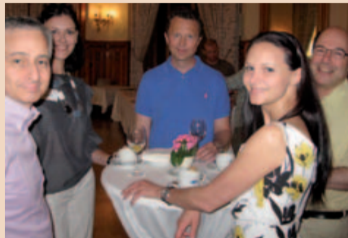
Die Veranstalterin der „European Society of Microscope Dentistry“ im Gespräch mit Dr. Sirtes und Zahnärzten aus Litauen und Deutschland.

Mikroskopiker, aber auch Einsteiger in die Dentalmikroskopie vom